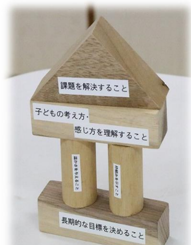
ワークショップ用のPDモデルのつみき